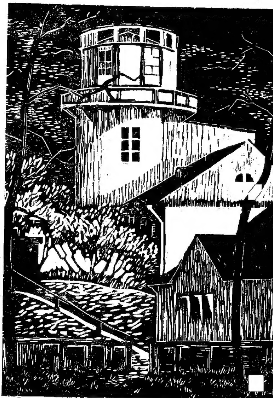
Tartu tähetorn. Linoollõige.